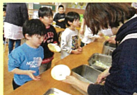
小学校の給食をおかわりました！

1月17日（金）5歳児が東通小学校の給食を食べに行きました。1月21日（火）は小学校の様子を見に行きました。就学まで2か月と少しです。不安なく新しい春を迎えられるよう、来月も5歳児は小学校との連携活動があります。