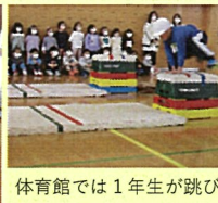
体育館では1年生が跳び箱を行っていました。